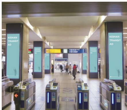
※京阪電車京橋駅改札内より撮影

乗降人数No.1の京橋駅中央改札口に立ち並ぶ60インチ液晶画面を縦に2段積みした迫力のある媒体です。