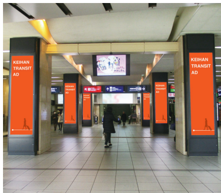
※JR京橋駅側より撮影